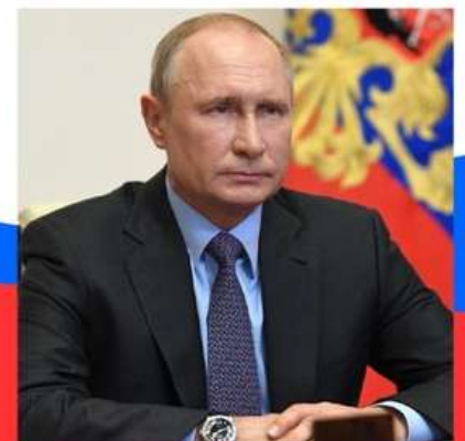
Владимир Путин Президент России

Очень надеюсь, что граждане примут в определении параметров Основного Закона, в голосовании по поправкам в Конституцию самое активное участие.